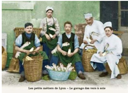
Les petits métiers de Lyon - Le gavage des vers à soie

MARSEILLE son incontournable savon La récolte des bulles