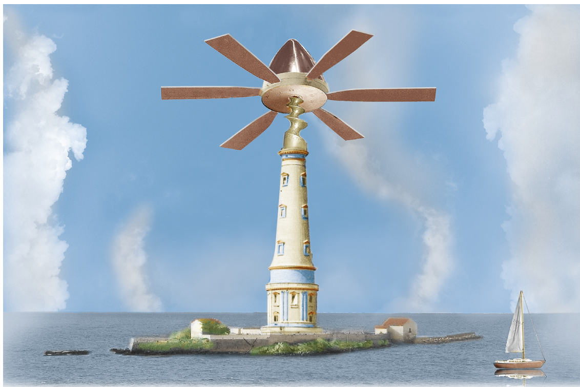
L'anticyclone des Açores, à l'arrêt.

Réjouissez vos citoyens et votre public en célébrant leur ville, leur région, leur culture !