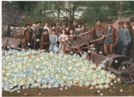
1900 - Récolte des bulles de savon dans la région marseillaise

MARSEILLE son incontournable savon La récolte des bulles