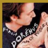
Pas en parler (Autoproduit) 14 titres • 2005