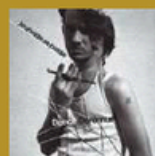
Jeunesse se passe (EMI) 14 titres • 2007