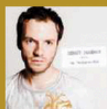
En tachycardie (Déjà) 17 titres • 2016