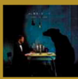
Comme un ours (La Familia) 12 titres • 2018 Obs. : un live de 23 titres est publié en 2020.