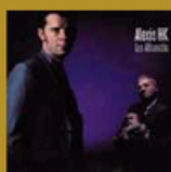
Les affranchis (La Familia) 12 titres • 2009