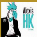
Le tour des affranchis live (La Familia) 4 titres • 2012