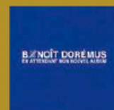
En attendant mon nouvel album (EMI) 5 titres • 2010 Obs. : cinq titres en version acoustique.