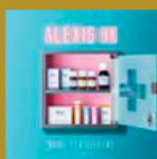
Bobo playground (La Familia) 12 titres • 09/2022