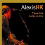
C'que t'es belle en live (Labels) 9 titres • 2005