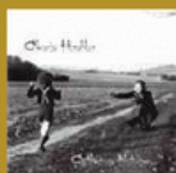
Anti-héros notoire (Musiques Hybrides) 11 titres • 1996