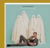
Désolé pour les fantômes (Déjà) 14 titres • 02/2022