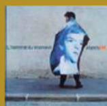
L'homme du moment (Labels) 11 titres • 2004