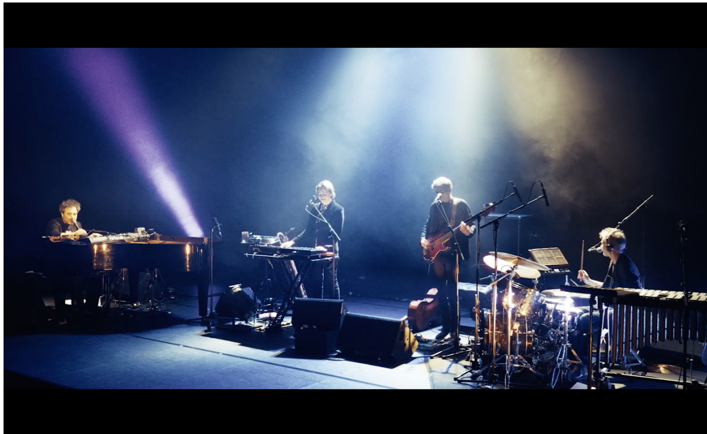
Filmé les 4 et 5 avril 2025 à la Maison des Métallos Réalisation - Yvan Schreck