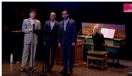
Weelkes / Byrd Four Arms / Messe à 3 voix France Musique