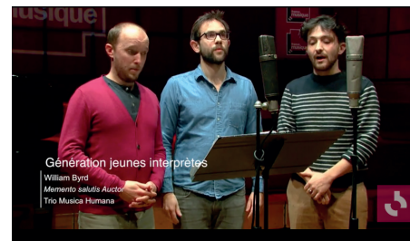
William Byrd - Memento salutis Aucto France Musique